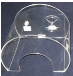
OH7 و OH5

شرکت تابان پرتو کوش ، سه سایز اکسی هود ، با اندازه های مختلف ، تولید میکند . این اکسی هود ها با مدل های OH5- OH7- OH10 و با مشخصات زیر ساخته میشوند .